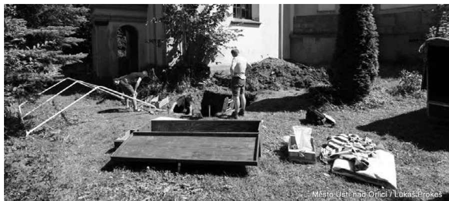
Město Ústí nad Orlicí / Lukáš Prokeš

Hlavní stavební práce na revitalizaci „starého hřbitova“ a propojení centra s částí u Roškotova divadla začnou do konce měsíce srpna. Nově zde vznikne relaxační a klidová veřejná plocha, chodničky doplněné mobiliářem, veřejné osvětlení a vybudován bude průchod skrz ohradní zeď pod kostelem. Celý prostor kolem kostela se tak zpřístupní veřejnosti a přispěje ke snadnějšímu propojení obou lokalit.