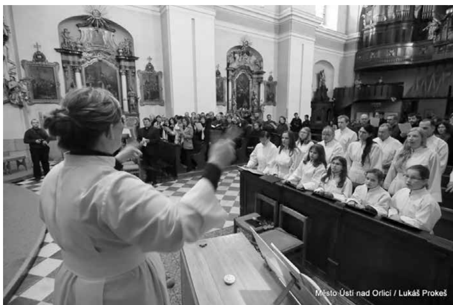
Město Ústí nad Orlicí / Lukáš Prokeš

Festival se koná za finanční podpory Města Ústí nad Orlicí, Pardubického kraje.