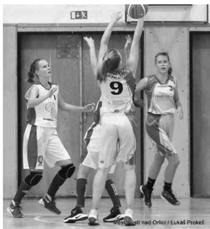
Ústí nad Orlicí / Lukáš Prokeš