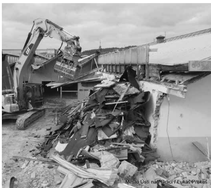
Město Ústí nad Orlicí / Lukáš Prokeš