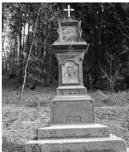
Pilíř s reliéfní výzdobou Knapovec – po opravě