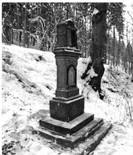
Pilíř s reliéfní výzdobou Knapovec – před opravou

Na základě podnětu Osadního výboru byl v loňském roce dokončen projekt „Po stopách kulturního dědictví“, v rámci kterého byla obnovena a restaurována umělecká díla v Knapovci a Dolním a Horním Houžovci. Vznikla tak ucelená turistická a meditační stezka, doplněná informačními tabulemi a odpočívadlem, o kterou se nyní starají obyvatelé, kteří záchranu iniciovali. Realizace byla ve výši 85 % nákladů finančně dotována z prostředků EU. Navazující etapa se připravuje k realizaci pro následující rok. O smysluplnosti projektu je nejlépe se přesvědčit osobně, výběr z fotodokumentace je jen pozvánkou a zároveň připomenutím zanedbaného stavu před obnovou.